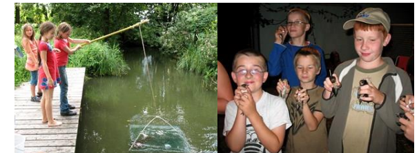
Kinder im NABU-Camp

Das Camp findet im Juli/August statt. Junge Menschen können auch in der Naturschutzjugend aktiv werden.