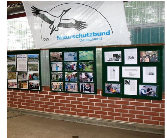
Im Ausstellungsraum der Station

Im Dezember 2009 haben wir die Vogelwachturm am Rietzer See vom Land Brandenburg gekauft. Sie ist jetzt ein Umweltbildungszentrum des NABU.