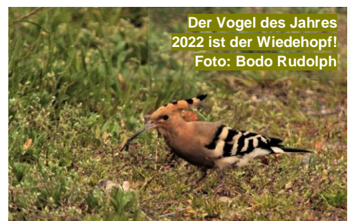
Der Vogel des Jahres 2022 ist der Wiedehopf!